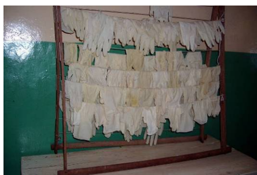
Couloir de la maternité / les gants sèchent ...