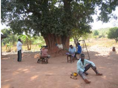
Des enfants handicapés mentaux accueillis dans la communauté de Bangwe