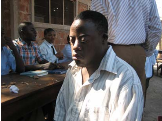
Un jeune avec syndrome de down accueilli dans la communauté de Bangwe I