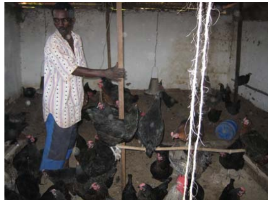
Petite exploitation de poulets au Centre de Bangwe I

Le centre veut l'autofinancement à travers de la culture de son propre jardin de potage et la ferme des animaux.