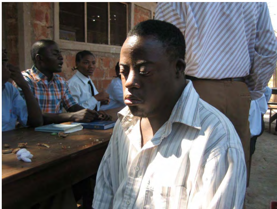
Un jeune avec syndrome de down accueilli dans la communauté de Bangwe I