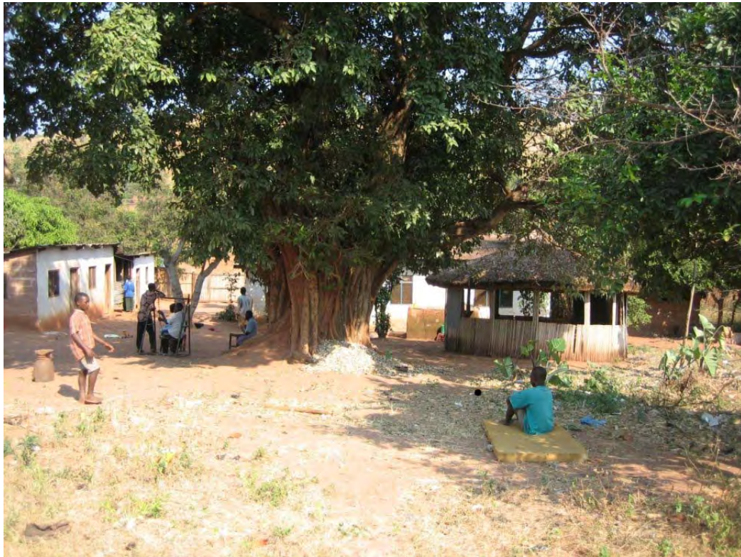
Centre pour handicapés mentaux de Bangwe, à Kigoma, créé en 2005

Dans la rue ces enfants cohabitent avec d'autres enfants que ne sont pas handicapés mais qu'ont été aussi abandonnés pour les familles pour différentes causes, presque toujours liés avec la manque de ressources et structures familiales.