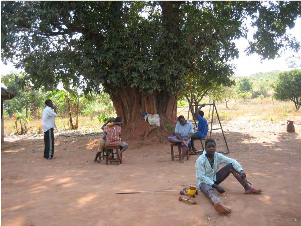
Des enfants handicapés mentaux accueillis dans la communauté de Bangwe