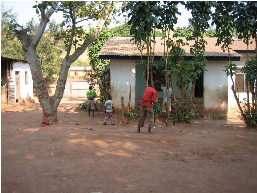
Centre pour des enfants handicapés mentaux et enfants de la rue de Bangwe. Dans un terrain voisin on veut construire le nouveau centre d'accueil.

Le nouveau terrain de Bangwe a été déjà acquis pour les frères de la charité. Maintenant sont nécessaires les matériels basiques de construction pour trois bâtiments simples à Bangwe. La communauté de Bangwe I contribuerait avec travail personnel dans la construction de Bangwe II.