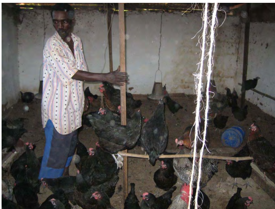
Petite exploitation de poulets au Centre de Bangwe I

Le centre veut l'autofinancement à travers de la culture de son propre jardin de potage et la ferme des animaux.